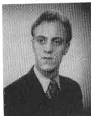
Bild på 4107 saknas