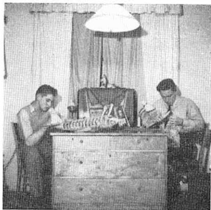
Julkappsbestyr på elevhemmet i Malmslätt. Hemmets fotoklubb har varit i aktion.

Hobbyverksamheten blomstrar också, modellflygplan och bilar byggs, "radioapparater lagas" och ändras om, och snart är det jullov!