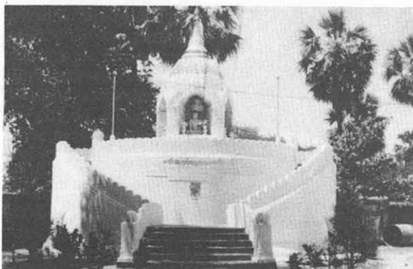
Del av Pagodan

Den sjunde januari hälsades jag så välkommen till Burma av världens största Pagoda, Shwedagon Pagoda, vars guldbelagda spira lyste likt en jätte fackla i den uppgående solen.