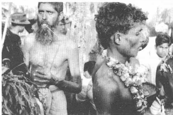
Förberedelse till eldfest

Burmeserna är ett glatt och sorglöst folk, de skrattar, ler och gnolar sina sånger, deras fester består i stor del av danser och under de stora högtiderna går rikt smyckade med blommor, korteger genom Rangoon och på varje fordon är det danserskor som utför österlandets vackra och graciösa danser.